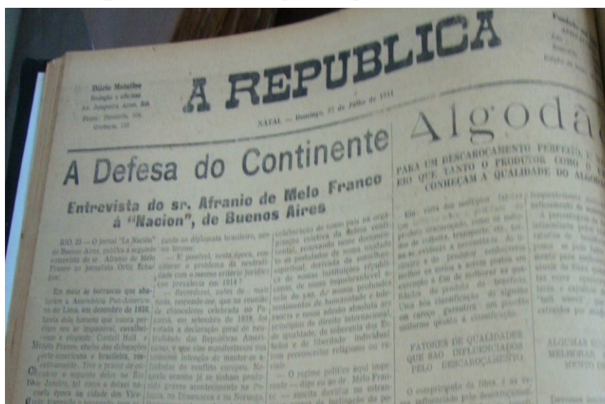
Figura 1: Parte da capa A República (1941)