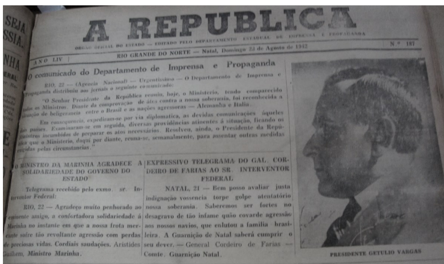
Figura 3: Capa A República (1942)

do mundo, agora buscava aproximar os acontecimentos, trazendo muito mais a cotidianidade e o social.