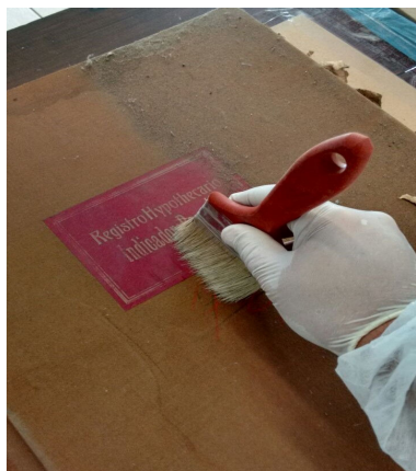
FIGURA 1: Higienização