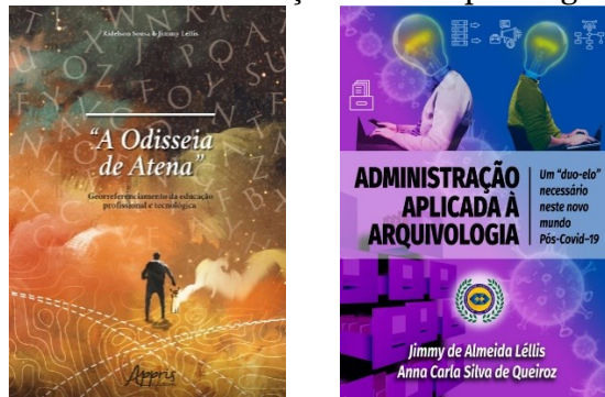
FIGURA 4: Produção científica em Educação e em Arquivologia aplicada à Administração