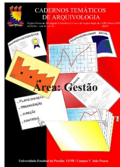
FIGURA 3: Produção científica docente através de Cadernos Temáticos